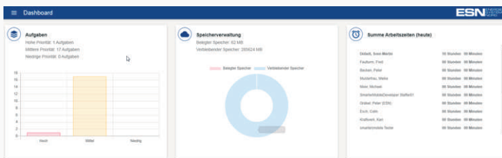
Abb. links: das neue Dashboard

Mit smarter|mobile 3 stehen neben bereits bekannten Funktionen viele neue Möglichkeiten zur mobilen Aufgabenbearbeitung bereit. Wir haben smarter|mobile vollständig überarbeitet. Unter der Haube ist alles neu und zukunftssicher, aber was Sie zuerst bemerken werden, ist die Kartenintegration für die leichte Orientierung unterwegs und die Push-Synchronisation zum flotteren Datenabgleich.